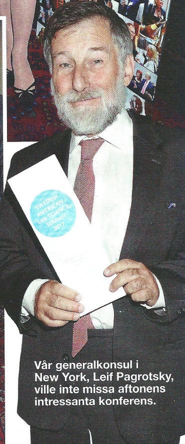
Vår generalkonsul i New York, Leif Pagrotsky, ville inte missa aftonens intressanta konferens.